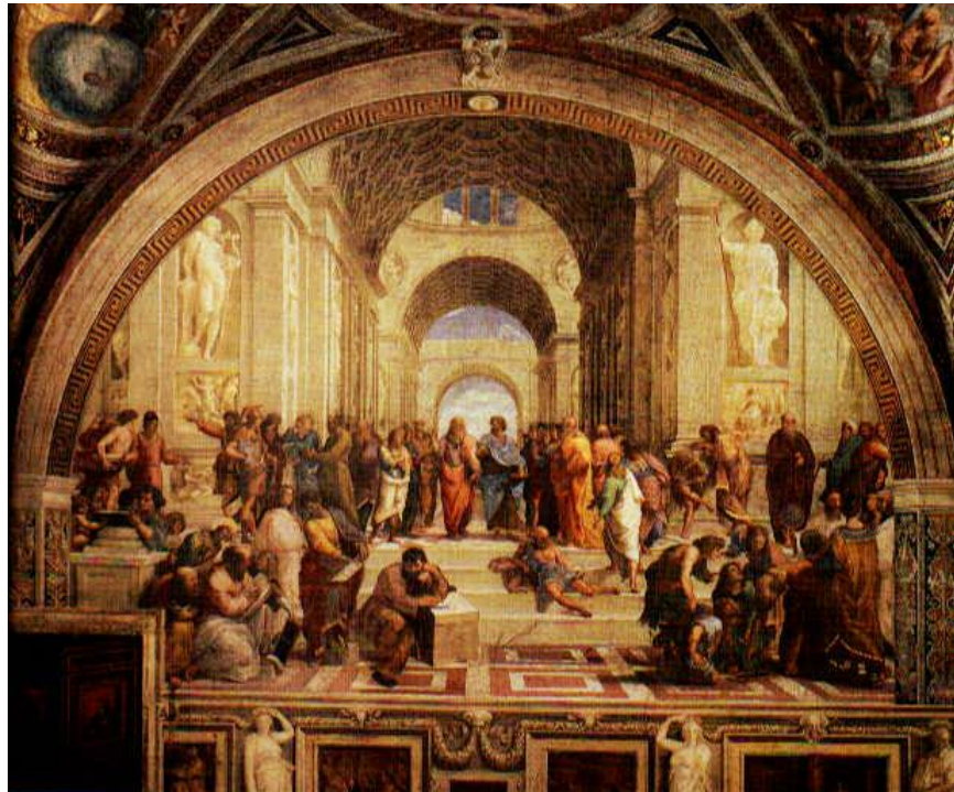
رافاییل/ تابلیۆی قوتابخانەى ئەسینا Rafael/ Athens